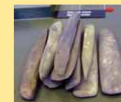
Jiný typ nástrojů vznikl broušením kamene.