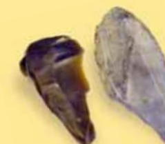
Tyto hroty vznikly odštípáváním pazourkového jádra.

Postup při výrobě kamenného nástroje: 1) Neopracovaný valoun pazourku. 2) Oklepáváním se vytvoří základní tvar ostří (drobné úštěpky se používaly na jiné typy nástrojů). 3) Další úpravy tvaru ostří. 4) Hotový výrobek.