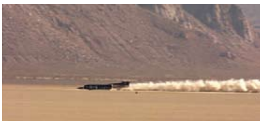
◀ Thurst SSC během rekordní jízdy.